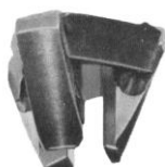
Cone do mandril